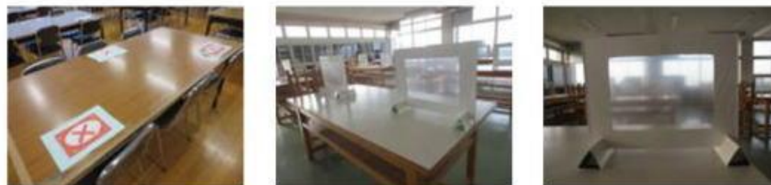
図書室のソーシャルディスタンス