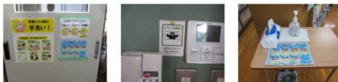
教室入室前の手洗い励行